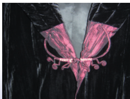
獨家盤扣開發運用增添價值與品味