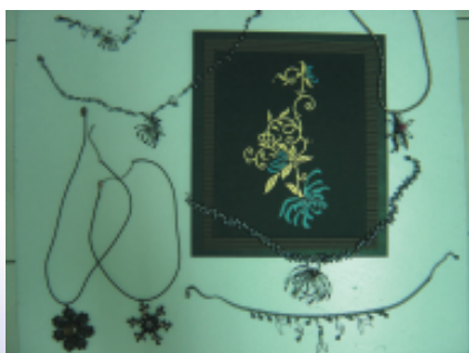
圖案開發飾品運用

透過本計畫之執行在圖案開發於半成品及（原材料）布料上之能力精進與提昇，同時運用在牛仔系列上之加值性圖飾及技術加工造成相關款式之暢銷及獨特之品牌形象，同時整個計畫開發合計 281 款，超過目標 40%。