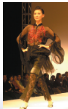
蕾絲布料刺繡圖芋附加及牛仔二次加工