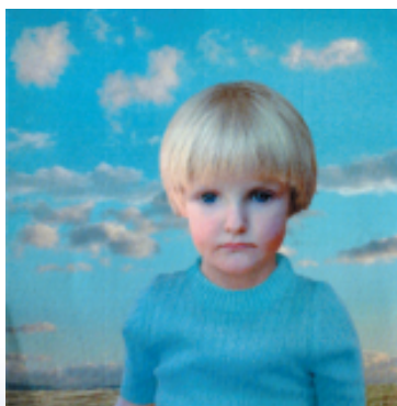
BOY BRIEF 男生宣言

未來內衣系列持續創意設計的同時，我們將積極努力致力於環保材料的開發使用，如有機纖維，有機棉等。實際運用於開發產品上，讓我們擁有美麗衣服的同時也擁有美麗地球。