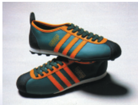
CLASSIC SPORT 古典的希臘運動風格 自然並且兼具中性的趨式