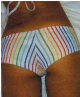
SUMMER AND BEACH 夏日沙灘