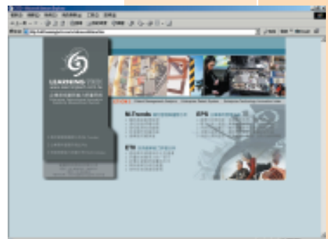
圖表 3 『專利基礎系統畫面』參考圖示