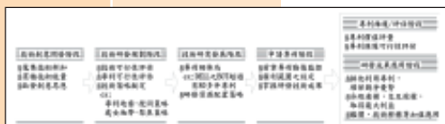
圖表 7 ETICM 成果應用範圍圖

再者，國內政府積極協助中小企業對於無形資產有形化之輔導，以利提供無形技術貸款之政策，本計畫開發完成，將可以對於技術鑑價之科技構面，有完整之服務提供，並在進行技術鑑價之基礎上，能有正確之資訊輔以使用。