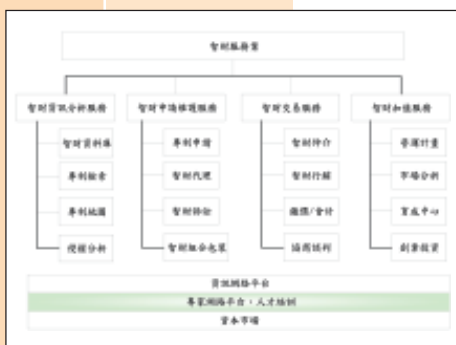
圖表 5 智財服務業範圍

上述問題發生時，透過團隊與教授們之溝通，相關技術研發方向可以快速被確認並提出適當解決方案。藉由本次之計畫執行經驗，本團隊學習可以依計畫時程進行，並且計畫工作中隨時紀錄相關作業內容，作為日後討論計畫規格使用，另遇有問題發生時，隨時與團隊人員討論研究；對於系統分析與設計人員，在一開始所有技術工具已嚴謹研究完成，並對於可能發生的問題，隨時與指導教授們保持溝通的管道與途徑，讓開發人員不致因為未擬訂完成之事項而延誤工作進度，反觀，可以事先且獨立擬定問題，提出解決問題之方案，是本計畫順利執行之重要學習與實證專案。