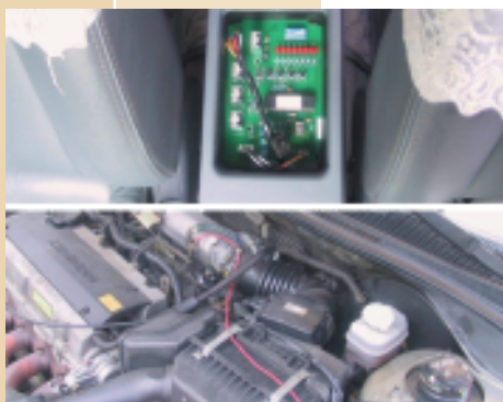
半主動懸吊系統安裝例圖

本系統的成功經驗，給予研發團隊很大的鼓勵，也是團隊最大的收穫。本公司將以此經驗為基礎，持續提昇懸吊系統之功能，給予客戶最佳之服務。