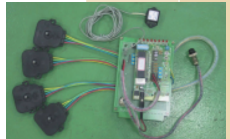
三段半主動懸吊控制系統

當前之懸吊系統，仍然以傳統不可調整(即彈簧常數及阻尼係數為固定值)之懸吊系統為主流。傳統不可調整之懸吊系統在設計時，車廠工程師們即