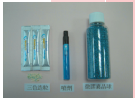
研發成果產品照片