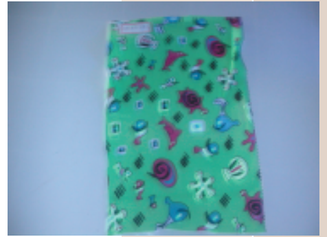
研製印花夜光織物