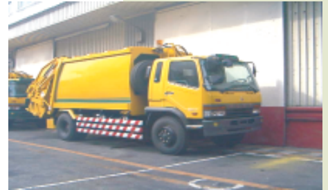
12M 3 垃圾車(弧形桶身)