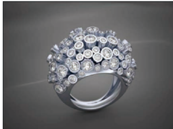
▲鑽石戒指加工範例

以銑刀機械式加工，加工寬度大於 0.2MM，深寬比 2:1，導入雷射非接觸加工後，可做出寬度 0.1MM，深度 0.4MM 的孔洞。雷射搭配機械加工之生產效率比純機械加工可達到 3 倍，且造型設計限制較少，有利於產品高值化。