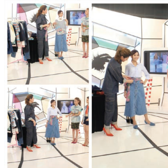
▲本計畫中所設計出的產品 UP 系列，參與了三立時尚節目單寧系列單元。