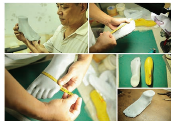
▲三代核心技術為基底，是我們發展創新的最佳後盾。