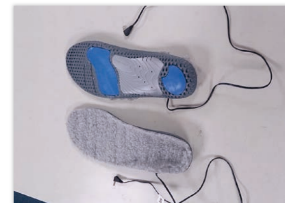
▲絕緣保暖鞋墊（版二）