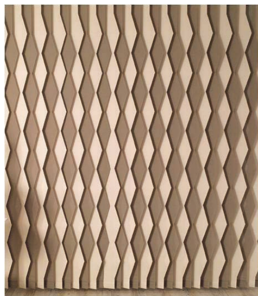
▲本計畫預計開發窗簾之示意圖

觀，達到造型多變及光線透射產生圖形排列的視覺豐富感。而要達到真正的遮蔽效果與多層次感覺，窗簾須要先經電腦軟體加以設計，並將設計軟體連結至窗簾自動切割機，而自動剪裁出來之窗簾尺寸需要和設計大小符合。