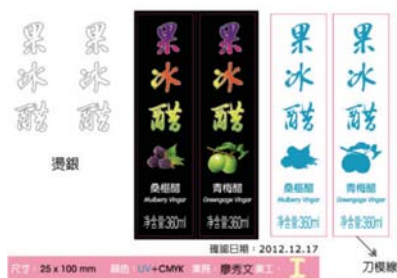
產品外包裝貼標式樣