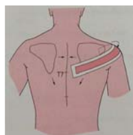
肩胛回縮 (Scapular Retraction)