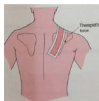
過度上揚斜方肌 (Overactive Upper Trapezius)