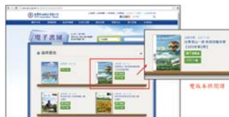
PDF版本，可直接閱讀或下載