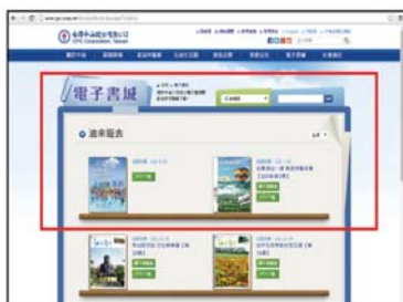
電子書城直接閱讀