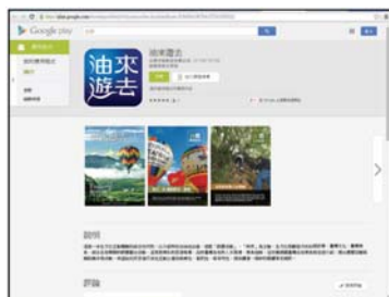
平板裝置Android系統直接下載