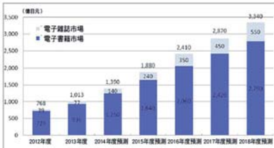
日本電子書市場規模的推估