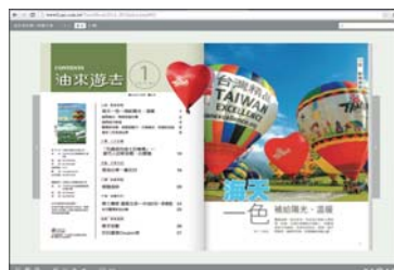
互動版本，操作直覺化、可全文搜尋、標記註解等功能機制完善。