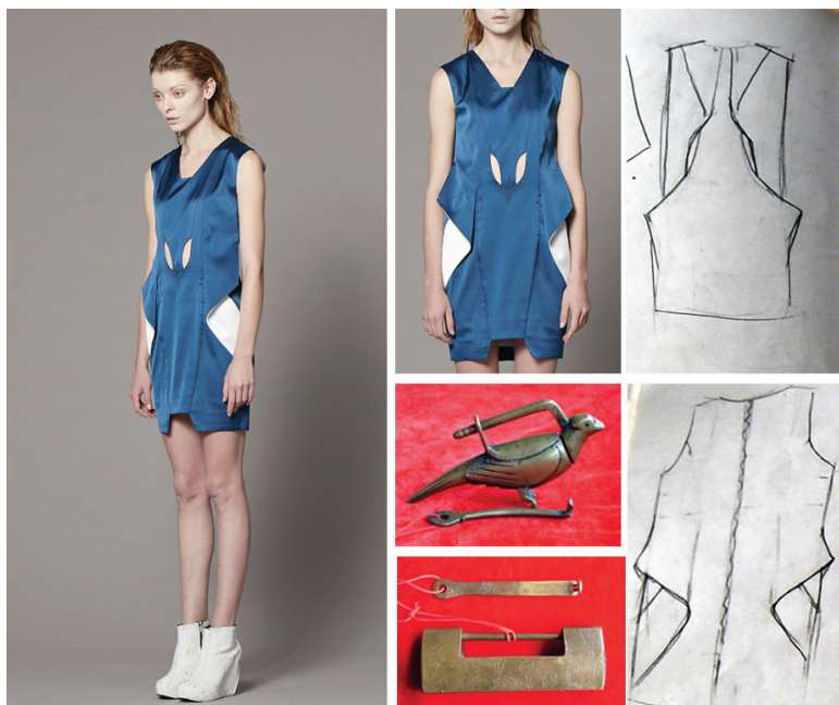
結合古中國吉祥物外型結合刻蝕元素

我們希望將古鎖的文化元素及意涵，帶入時尚服飾及袋包一系列的設計之中，以中國典雅風呈現作品風格，擷取古鎖的造型元素，融入現代圖騰的造型結構，取中國古銅鎖的外型特徵來作為設計發想，轉化為現代時裝設計：