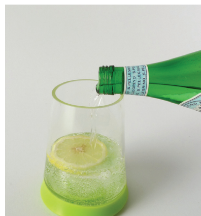
冰涼的飲料與美酒令人垂涎欲滴