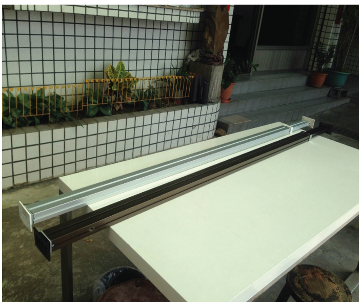
圖：具內藏式類棘輪緊固裝置之天地桿

本計畫擬開發的天地桿產品功能上為求定位更加確實、乘載力增加，捨棄有礙於外部美觀的機構，將新的機構藏置主體內部，改成由卡鉗與螺牙配合成的類棘輪機構，使外觀更加平整美觀且整體作動簡單確實、降低危險，不論用途、結構、便利性皆顛覆舊有天地桿。外觀設計圖與成品如下：