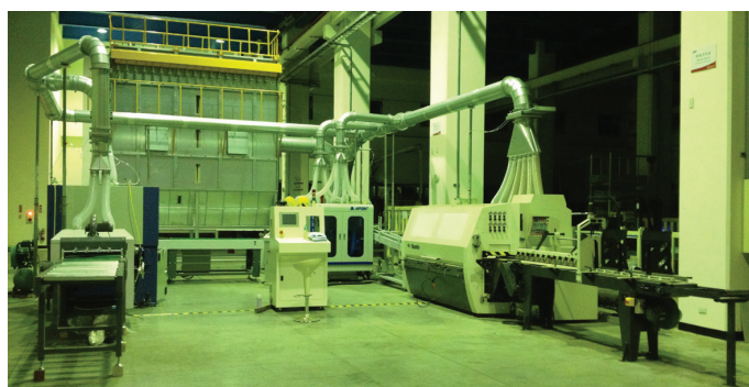
實木地板前段製程加工設備實體產線 2