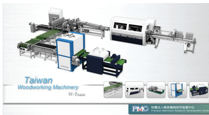
實木地板前段製程加工設備虛擬產線