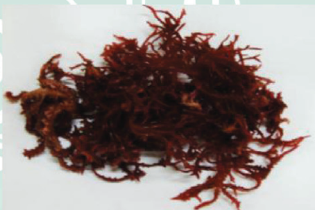
澎湖產珊瑚草外觀