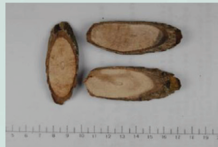
台灣南投縣所產刺五加切片外觀