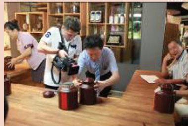
圖說/1963 年份老茶發表並帶動新茶收藏寫下品賞的感言,封存,預期下一個十年二十年的美好茶湯