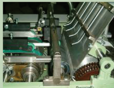
二次摺銷定位折頭系統