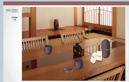
圖 3 使用情境狀況