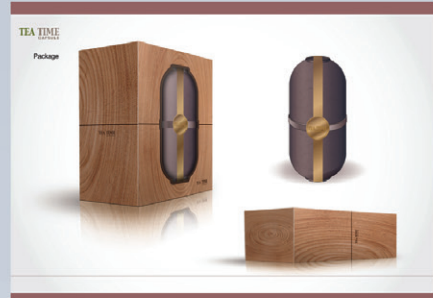
圖 4 茶杯罐包裝示意圖