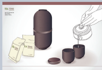
圖 1 茶杯罐茶杯情境示意圖

本計畫將老茶存放越久價值越高的特性，搭配上時空膠囊的概念，將外觀設計為膠囊外型，並在外層標註老茶年份，仿效紅酒年份的價值性，增加其經濟價值。透過創新的外型設計也將可如展示品般放置於架台上、客廳的展示櫥窗上以，可改變一般茶葉真空包裝無法達成的其他功能。