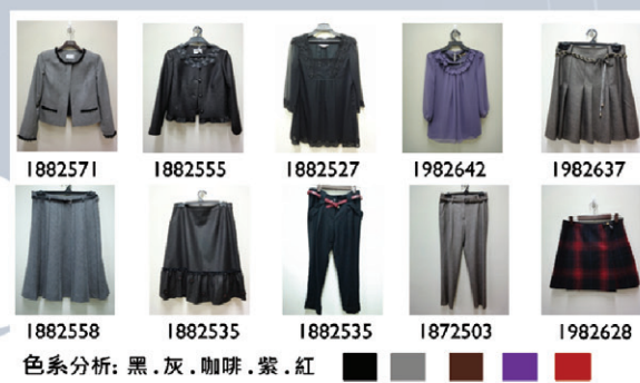
3. 精緻休閒:格子長版上衣·附腰帶長褲