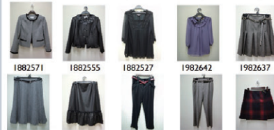
b.都會上班族:毛料套裝,雪紡上衣,摺裙

1882571 1882555 1882527 1982642 1982637 1882558 1882535 1882535 1872503 1982628