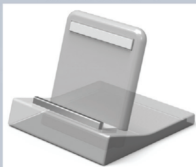
智慧型手機座架(二)